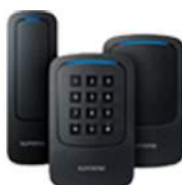
XPass 2 XPass D2