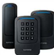
XPass 2 XPass D2